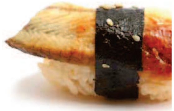
Fintele is bekend om zijn lekkere palingrestaurants

i Voor vaarkarten, bootverhuur en achtergrondinfo: zie p. 20