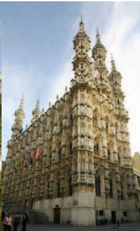
Het stadhuis van Leuven