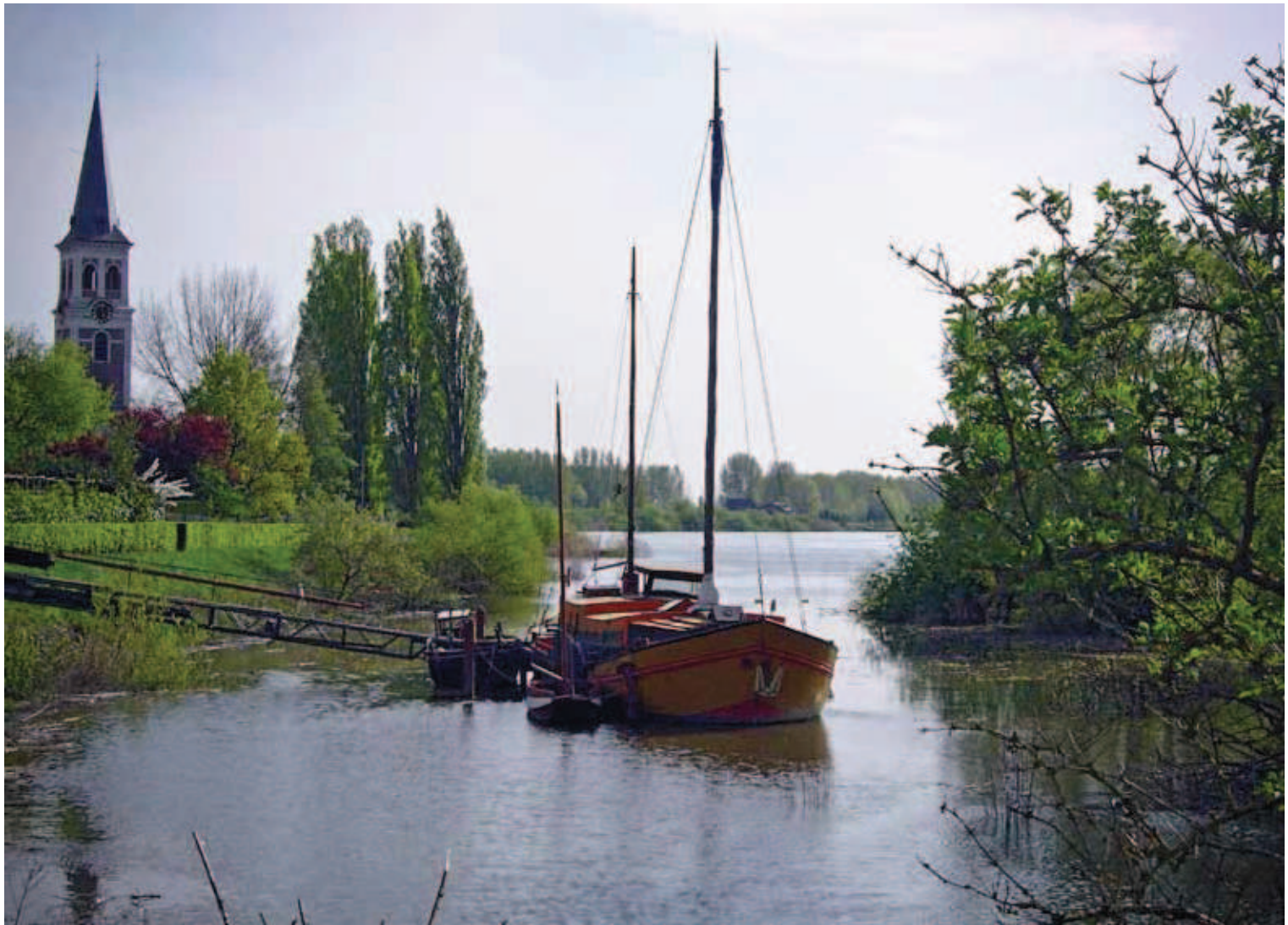
Scheldezicht bij Sint-Amands