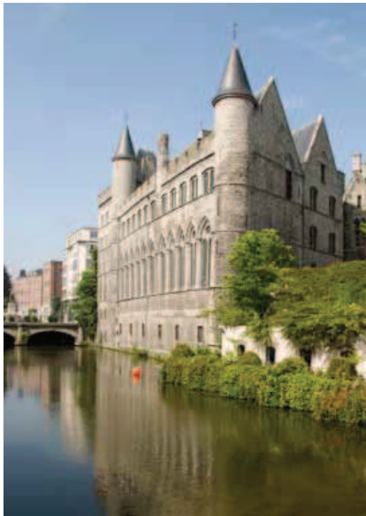
Het Geraard De Duivelsteen in Gent